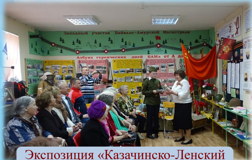
Экспозиция «Казачинско-Ленский район – фронту»