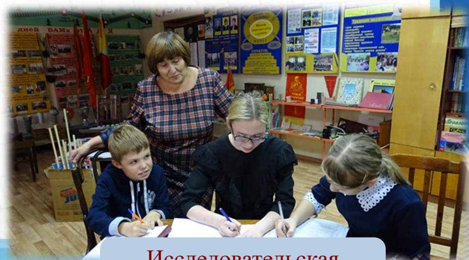
Исследовательская работа с детьми