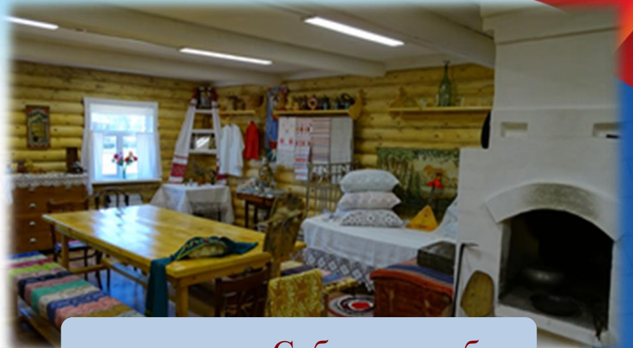
экспозиция «Сибирская изба»