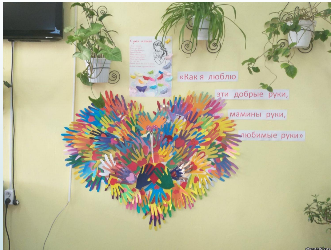
Акция «Мамины руки»