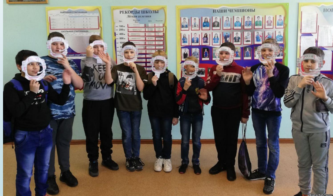
Акция «Привет в НЕВЕСОМОСТЬ»