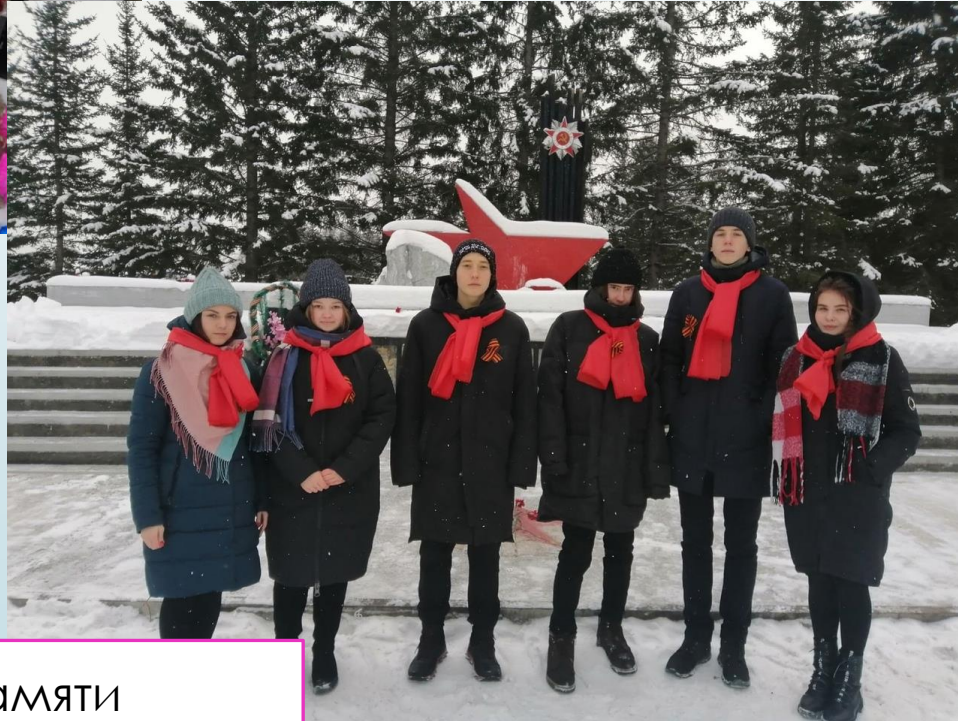
День памяти неизвестного солдата