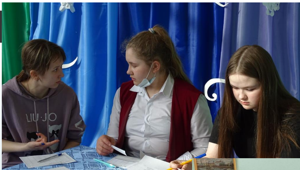
Игровая программа «Весенние забавы»