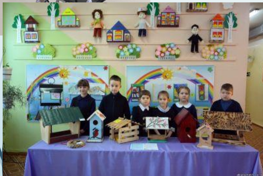
конкурс "Кормушка своими руками"