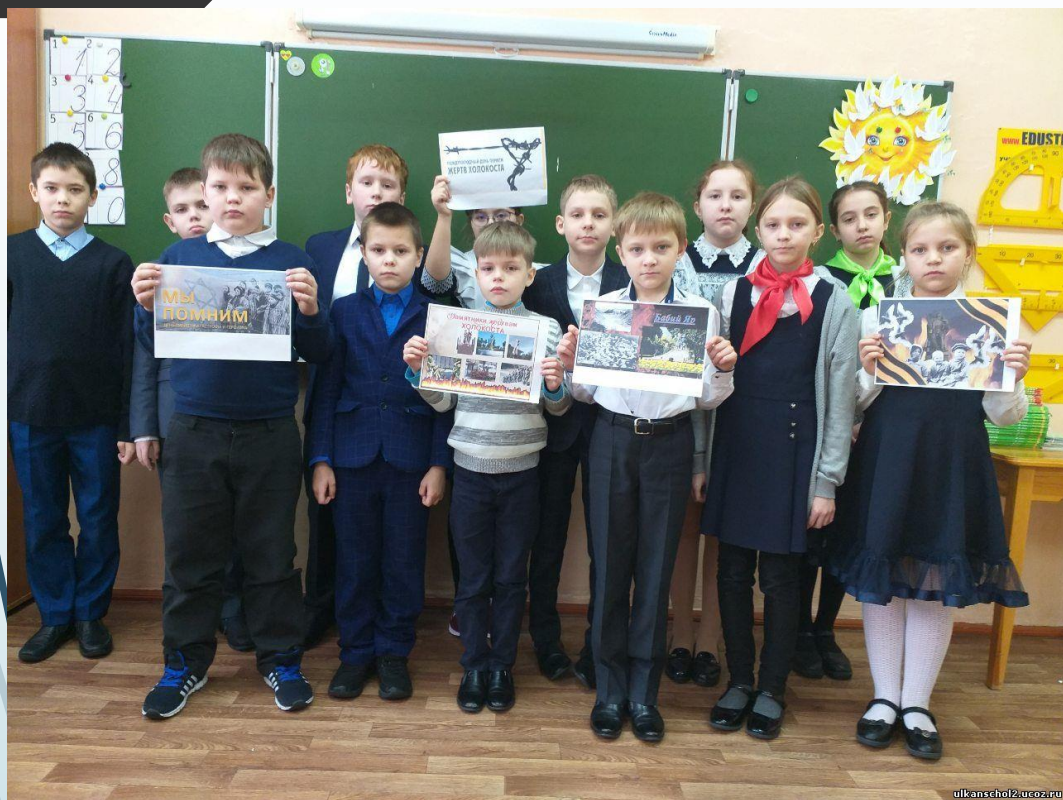
Международный день памяти жертв Холокоста