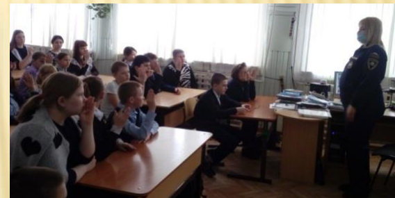
Внеклассное мероприятие «Профессии наших родителей»