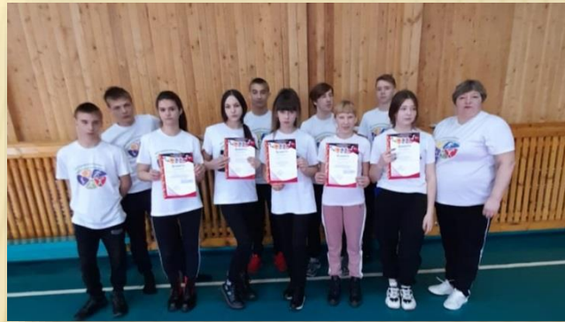
Районные соревнования по волейболу