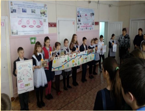
Информационная линейка «БAM – 45 лет»

Система мероприятий, направленных на познание историко - культурных корней, осознания неповторимости Отечества, его судьбы, неразрывности с ней, формирование гордости за сопричастность к деяниям предков и современников и исторической ответственности за происходящее в обществе, формирование знаний о родном поселке, районе.