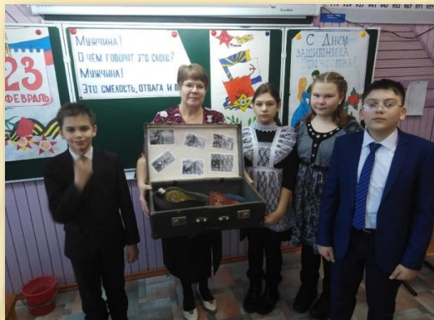
Классный час «Защитники страны»