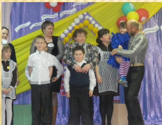
Традиционный праздник «День семьи»