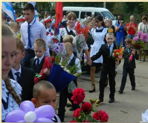
Традиционная линейка, посвященная началу учебного года