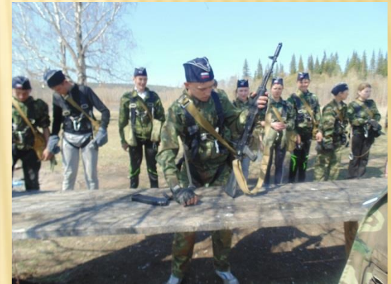
Районная игра «Зарница»