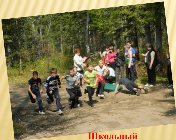
Школьный туристический слет