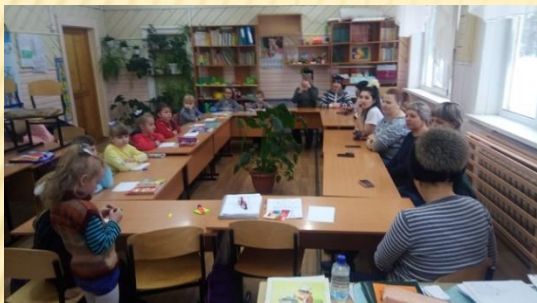
Родительское собрание «Моя семья»

Узнавая о своих корнях, о своих предках, дети через жизнь близких им людей познают историю Родины, она становится ближе и понятнее, поскольку окрашивается их переживаниями.