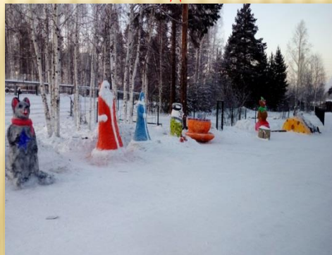
Акция «Красота своими руками»