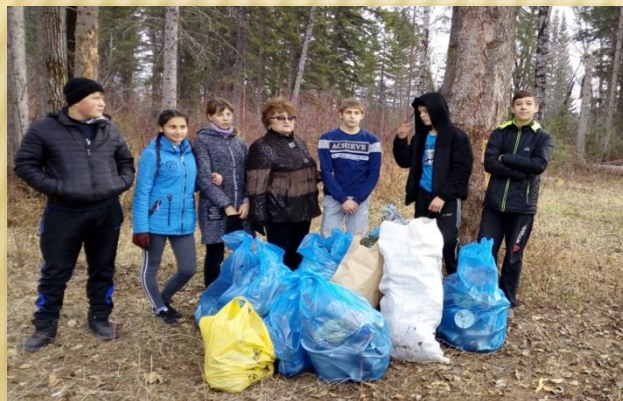
Уборка мусора на берегу реки Киренга