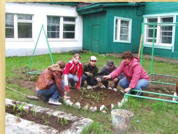
Проект «Зеленая лужайка»