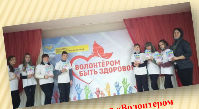
Районная акция «Волонтером быть здорово»

Патриотическое воспитание способствует сплочению классного коллектива, духовному обогащению личности ребенка, проявлению его лучших качеств: доброты, отзывчивости, милосердия, стремления сделать хорошее для других.