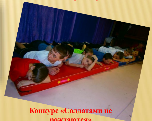
Конкурс «Солдатами не рождаются»