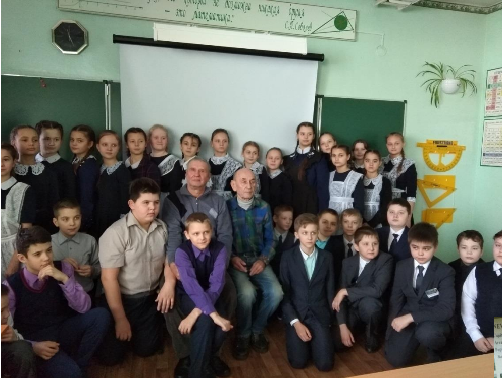
Встреча с воинами-интернационалистами